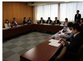
議会運営委員会の様子